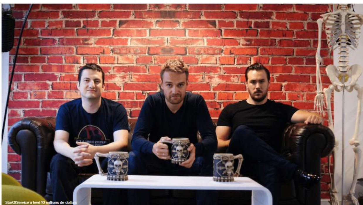
StarOfService a levé 10 millions de dollars par Iris Maignan — 23 septembre 2016 17h39