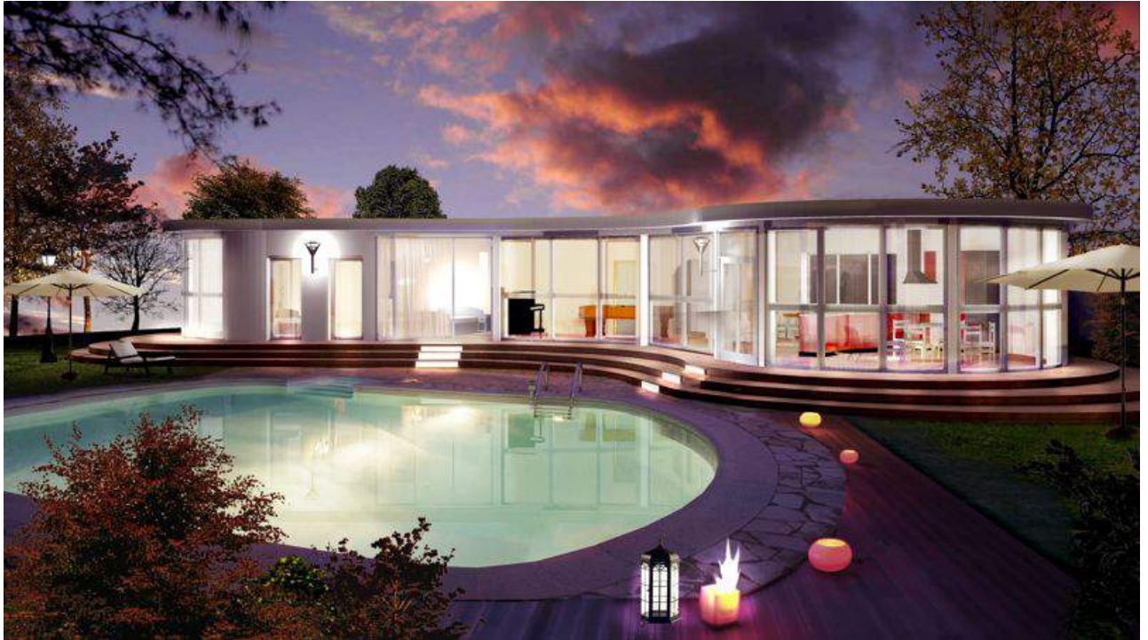
La construction de la maison «Fourmie» est estimée entre 175.000 et 225.000 euros

Par Géraldine Russell Mis à jour le 27/07/14 à 15:34 Publié le 26/07/14 à 06:00